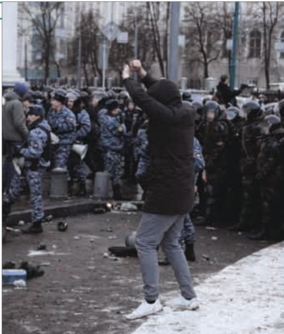
Манежная площадь, 11 декабря 2010 г.