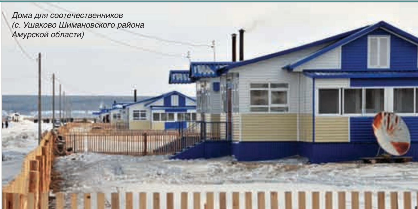
Дома для соотечественников (с. Ушаково Шимановского района Амурской области)

ших решение переселиться в Российскую Федерацию, прежде всего — в стратегически важные ее регионы. Жизнь показала, что нельзя оставлять без внимания вопрос жилищного обустройства, поскольку отсутствие жилья является сегодня основным тормозом в реализации программы.