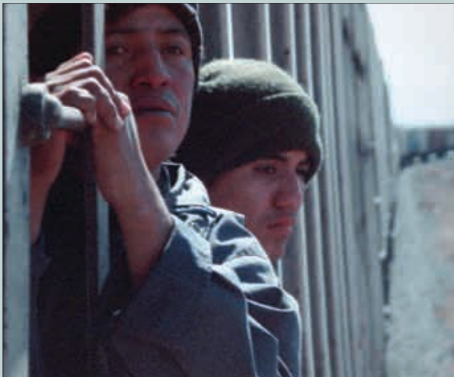
Фоторабота с выставки в Конгресс-центре

и даже враждебность со стороны местного населения, что провоцирует ответную агрессивность. В результате формируется устойчивое восприятие миграции как «проблемы, которую нужно решать». И до тех пор, пока миграция не будет восприниматься — и теми, от кого зависит разработка и осуществление миграционной политики, и обществом в целом — как «ресурс,