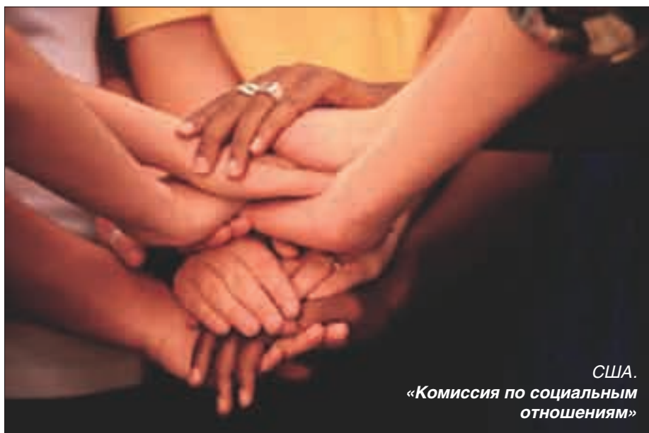
США. «Комиссия по социальным отношениям»

Существующий международный опыт адаптации и интеграции мигрантов, несомненно, мог бы быть эффективно применен и в России. Особое внимание следует обратить на привлечение к этой сложной работе ресурсов гражданского общества. Например, можно было бы использовать потенциал такого общественного движения, как «Форум переселенческих организаций». За 15 лет деятельности лидеры переселенческих НКО, живущие в разных областях России, накопили ценный опыт адаптации и интеграции и могли бы стать надежными партнерами государственных органов, как это практикуется во всех развитых странах, принимающих мигрантов.