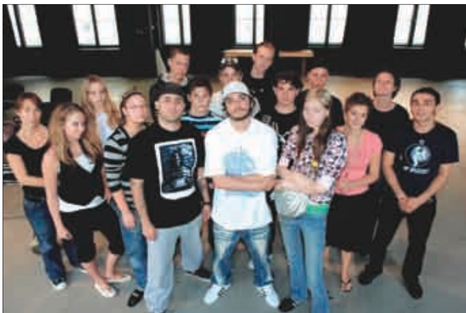
Германия. Участники общественной организации «Покажи лицо»

Сотрудники MOM рассчитывают, что помощь, оказываемая конкретным мигрантам, будет, несомненно, способствовать их интеграции и в какой-то степени будет содействовать налаживанию межнациональных отношений в российском обществе. Однако совершенно понятно, что в рамках одной программы просто нереально существенно изменить напряженную миграционную ситуацию