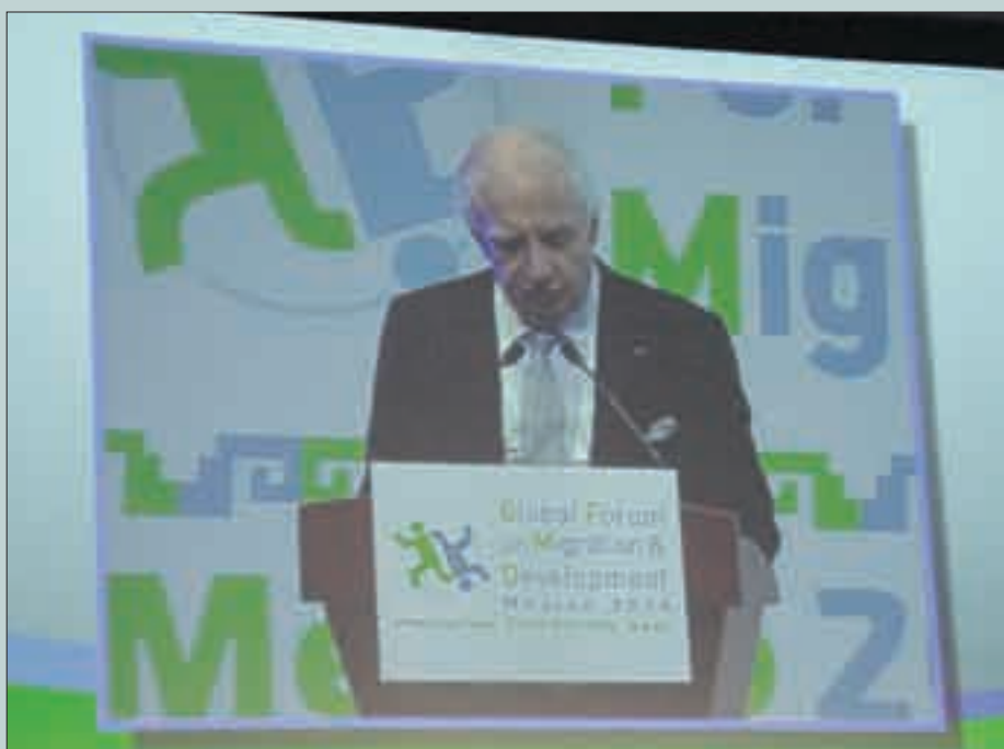
Выступление на пленарном заседании специального представителя Генерального секретаря ООН по миграции и развитию Питера Сазерленда

Сильное впечатление произвело осознание участниками Форума, представляющими гражданское общество, своей реальной причастности к действительному превращению миграции в ресурс развития своих стран, улучшению положения мигрантов, их информированности, защищенности, включенности в жизнь принявшего их сообщества. Или наоборот — осознание своей ответственности за судьбу возвращающихся домой мигрантов, помощь им в организации собственного дела или устройстве на работу по найму.