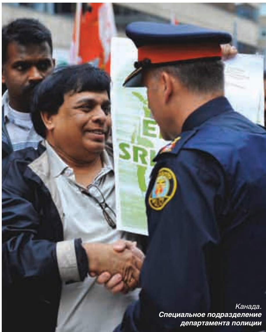
Канада. Специальное подразделение департамента полиции

В Германии, например, действует ряд общественных организаций, фондов, ассоциаций, успешно решающих проблемы иммигрантов. Уже более 10 лет общественная организация с красноречивым названием «Покажи лицо» активно помогает адаптации приезжих к местному образу жизни, принятым нормам поведения и одновременно старается адаптировать местных жителей к присутствию мигрантов. Сотрудники организуют специальные «знакомства» групп мигрантов с молодежью, чтобы местные подростки узнали больше о жизни и обычаях своих сверстников и смогли преодолеть в себе этот известный «страх чужого». Берлинские школьники охотно участвуют в экскурсиях на предприятия, где трудятся приезжие, и там они осознают, как нелегко зарабатывают свой хлеб эти приезжие. Организация оказывает психологическую и правовую помощь пострадавшим от националистов. В особо конфликтных ситуациях эта НКО даже помогает мигрантам переселиться в другие города. Сотрудники отслеживают ход раскрытия преступлений, совершенных на почве национально-религиозной вражды, привлекают к работе СМИ. Вот один наглядный пример: организации стало известно, что был избит русский