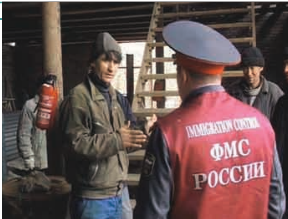
Мигрант, получив патент, напрочь выпадает из поля зрения контролирующих органов

ных граждан, осуществляющих трудовую деятельность у физических лиц, составит 2 000 000 в 2010 году. Прогнозировалось поступление в доход бюджетов субъектов Российской Федерации «выручки от продажи патентов» в объеме от 12 до 24 миллиардов рублей ежегодно. Откуда взялись такие цифры?