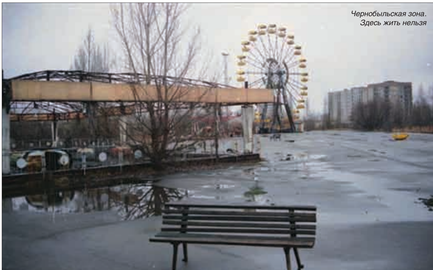
Чернобыльская зона. Здесь жить нельзя

В настоящее время площадь зеркала Аральского моря сократилась наполовину, а его объем — на три четверти. Бывшие прибрежные деревни и города теперь удалены от береговой линии на 70 км. В Приаралье резко возросла детская смертность. Увеличилось количество таких болезней, как туберкулез, инфекционные и паразитические — тиф, гепатит, психосоматические заболевания и т. д. Здесь уже речь идет о нарастании глобальной напряженности в обществе, снять которую может только организованная экологическая миграция.