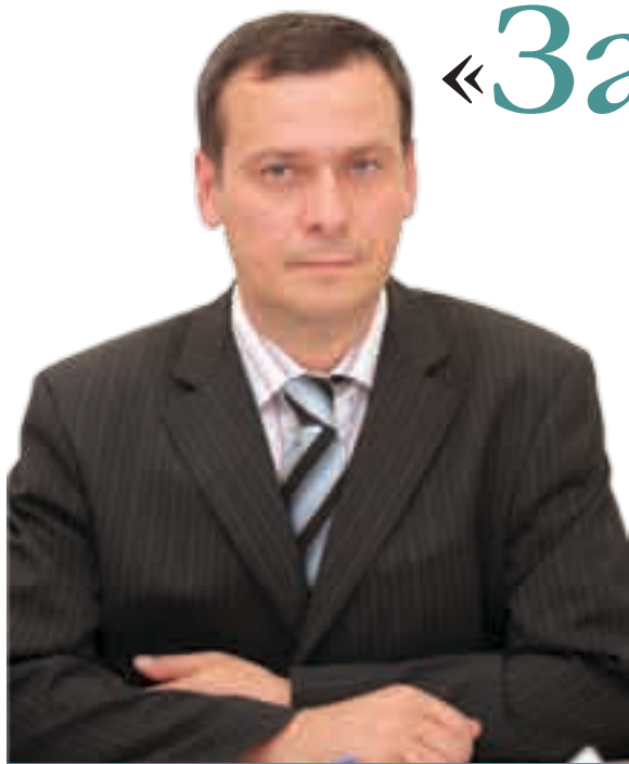
Виталий Яковлев, начальник Управления по делам соотечественников ФМС России