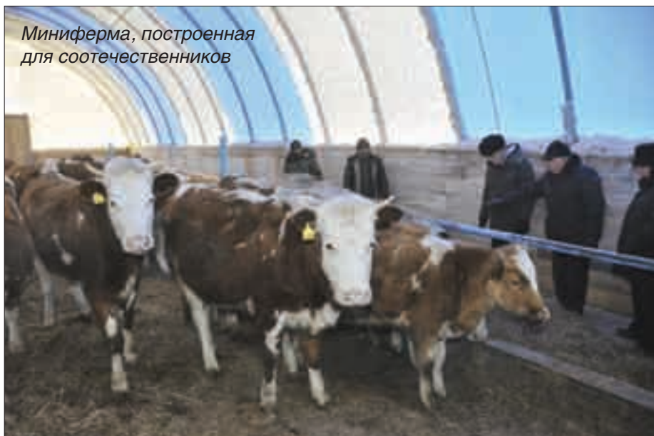
Миниферма, построенная для соотечественников

действительно привлекательных условий для потенциальных переселенцев. И, снова подчеркну, мы должны думать не только о том, где переселенцы будут работать, но и озаботиться решением очень сложной в наших российских реалиях проблемой: а где эти семьи будут жить? Первым шагом в этом направлении могло бы стать создание во всех субъектах, реализующих Госпрограмму, таких центров временного размещения, какие уже работают, например, в Калининградской и Липецкой областях. Весьма существенно, чтобы соотечественники, проживающие в этих центрах, скажем, в течение первых 6 месяцев после приезда, могли бы там же и регистрироваться по месту жительства, что облегчало бы им путь к предусмотренному законодательством быстрому получению гражданства России.