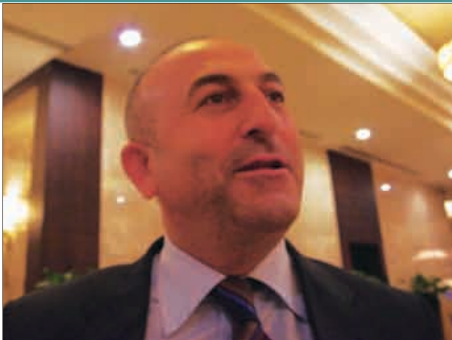
Мевлют Чавушоглу, председатель Парламентской Ассамблеи Совета Европы:

В беседе с Чавушоглу меня больше всего интересовало европейское видение проблемы миграции.