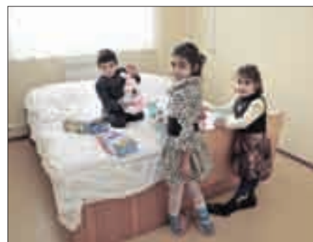
Приезжают многодетные семьи

Залогом успеха такой деятельности является объединение усилий федерального центра и региональных властей в создании